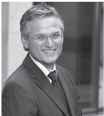
Dr. Peter Frey ZDF-Chefredakteur, geboren am 4. 8. 1957 in Bingen am Rhein, verheiratet, eine Tochter

Malteser Migranten Medizin fragt nicht nach Papieren und Krankenversicherung, sondern hilft, wenn eine Wunde versorgt werden muss, ein Zahn eitert oder ein Kind auf die Welt kommen soll. MMM – das ist „Hilfe den Bedürftigen“, nicht nur für die viel zu vielen „Illegalen“ in Deutschland, sondern auch für die wachsende Zahl derjenigen, die, warum auch immer, aus unserem Krankenversicherungssystem gefallen sind. „Die im Dunkeln sieht man nicht“, heißt es bei Bert Brecht.