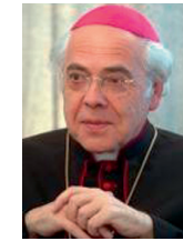
Weihbischof Josef Grünwald

Gemäß dem Leitsatz der Malteser sind „Bezeugung des Glaubens“ und „Hilfe aus Liebe zu den Armen“ wesentlich und untrennbar miteinander verbunden. Im Armen selbst nämlich begegnet uns Christus ganz konkret, denn „in den Armen und Leidenden erkennt (die Kirche) das Bild dessen, der sie gegründet hat und selbst ein Armer und Leidender war.“ (LG 8) Die Malteser lassen Christus erkennbar werden in unserer Gesellschaft, sie geben ein leuchtendes Zeugnis für die Liebe Gottes zu den Menschen und für die Würde des auf Gott hin geschaffenen Menschen! Gerne übernehme ich die Schirmherrschaft und sage der Malteser-Migranten-Medizin, all ihren Förderern und Unterstützern, von Herzen Vergelt's Gott für diesen unentbehrlichen Dienst!