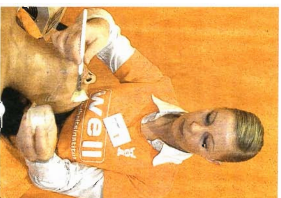
Spannung bei der Übung. Entspannung bei Wellness. Auch das gab's.