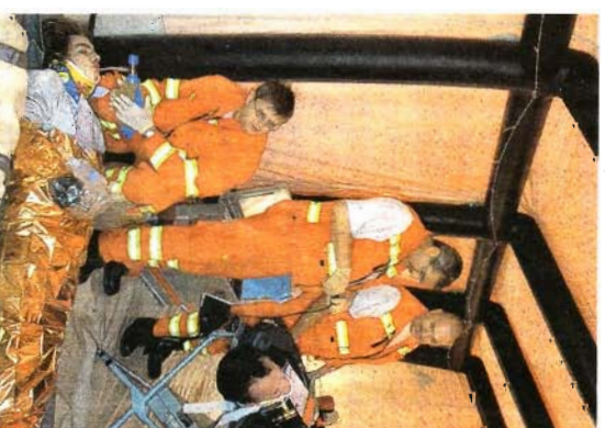
Polizei, Feuerwehr, Rettungskräfte: insgesamt 200 Personen waren bei der Übung im Einsatz.